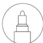
Bullet tip MEDIUM