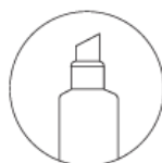
Chisel tip LARGE