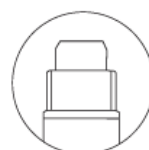
Chisel tip EXTRA LARGE