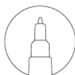
Bullet tip FINE